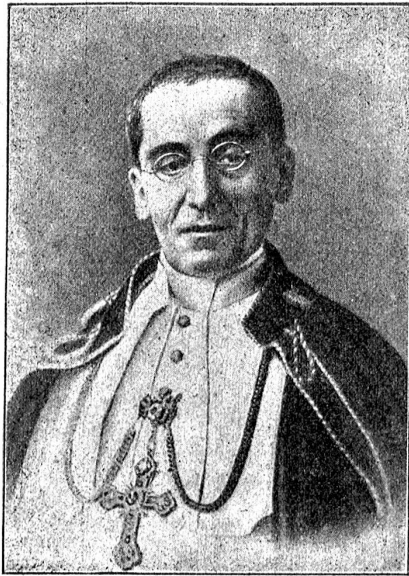
† Papst Benedikt XV.

für den Völkerverbund, erklärte in einer Rede zu Birmingham, die letzten Erklärungen Poincarés müßten als ein Anzeichen betrachtet werden, daß der Oberste Rat der Alliierten aufgehört habe zu existieren. Das ist eine Absage der