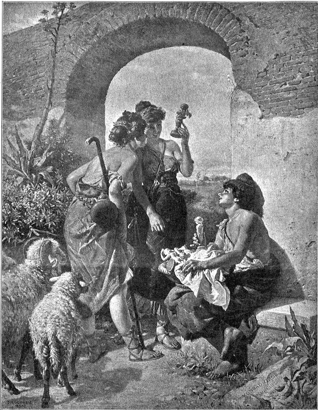
Die Hausgötterverkäuferin. Nach dem Gemälde von Konrad Grob.

Hand. Faber ließ sich nichts anmerken; aber das Zeichen, das ihm diese starke und gesunde väterliche Hand gab, hatte für ihn etwas Rührendes. Nicht umsonst wünschte ihm der alte Herr Befriedigung und Erfüllung seiner Wünsche. Im gleichen Alter hatte vor wenigen Jahren die Schwester den Tod gesucht; die Mutter der beiden war von Schwermut bedroht gewesen — alle Wünsche des alten Herrn gingen dahin, den Sohn glücklich zu sehen.