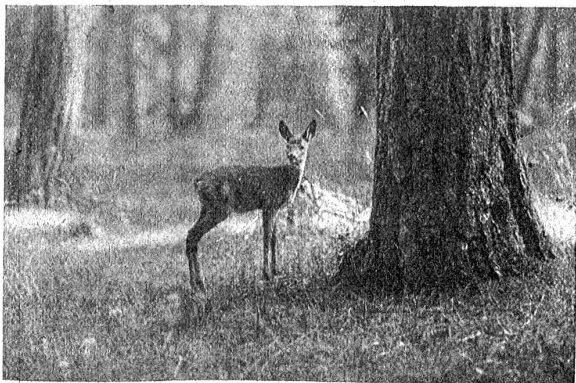
Junges Reh im Nationalpark.

Als der Nationalpark ein Gebiet von zirka 20 km 2 (1910), ja noch von rund 70 km 2 (1913) umfaßte, konnte der Schweizer. Bund für Naturschutz alle Kosten noch selbst bestreiten. Als jedoch das Parkgebiet auf rund 140 km 2 ausgedehnt wurde, reichten die Mittel nicht mehr hin, weshalb die Hilfe der Eidgenossenschaft in Anspruch genommen werden mußte. Es kam wenige Monate vor Ausbruch des Weltkrieges zu einer Vereinbarung, wonach die Eidgenossenschaft die Pacht bis zum Höchstbetrage von 30,000 Franken auf sich nahm, während der Schweiz. Bund für Naturschutz sich zur Uebernahme der Kosten für den Unterhalt, die Ueberwachung und für die wissenschaftliche Erforschung (jährlich über 30,000 Fr.) verpflichtete. Um das Parkgebiet