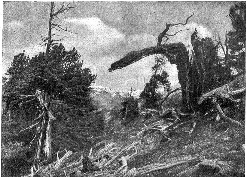
Urwald im Nationalpark.

für eine unbegrenzte Zeitdauer zu sichern, wurden mit den verschiedenen beteiligten Gemeinden Dienstbarkeitsverträge abgeschlossen.