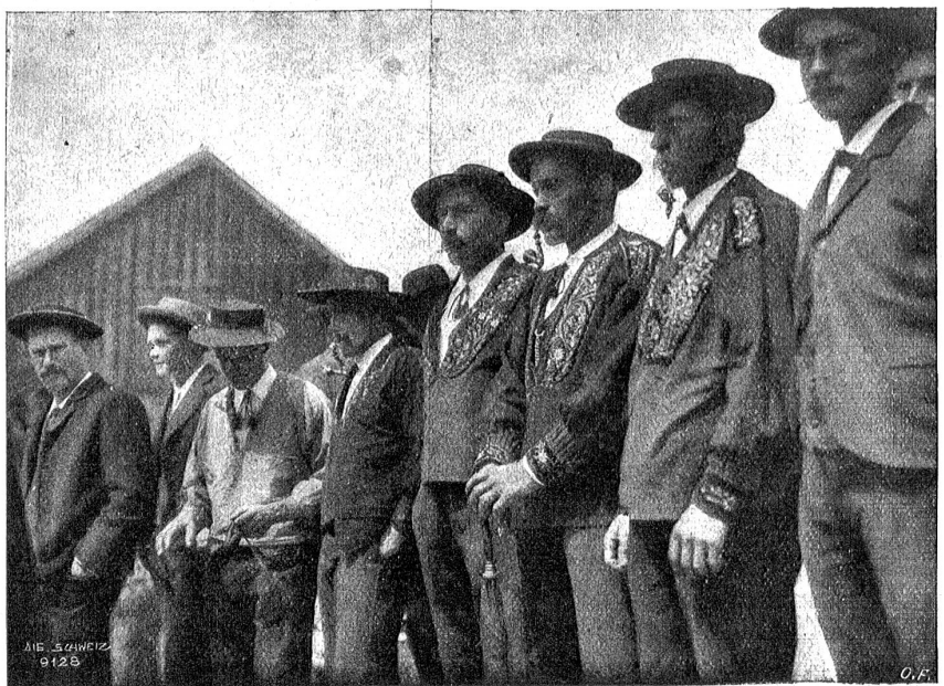
Typen von der Nidwaldner Landsgemeinde.

In Uri wird der Landsgemeindefesttag in allen Pfarrkirchen des Kantons mit besonderem Gebete und feierlicher Messe und Hochamt begonnen. Gegen elf Uhr begibt sich der Landammann, von Weibern begleitet, auf das Rat-