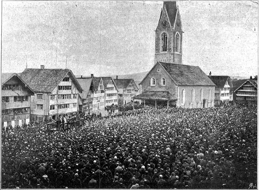
Die Appenzeller Landsgemeinde (A.-Rh.) in Hundwil.

haus zu Altdorf. Auf dem Platze vor dem Telldenkmal empfängt ihn eine militärische Ehrenkompanie mit dem Landespanner, der Musik und den beiden Harshornträgern unter dem Spiel des Fahnenmarsches. Nachdem sich auch die übrigen Mitglieder der obersten Behörden eingefunden haben auf dem Rathaus, setzt sich von da aus der Landsgemeindezug nach Böhlingen in Bewegung. Voran schreiten die beiden sogenannten „Tellen“, die, in altturnerische gelbschwarze Kriegertracht gekleidet, die mächtigen Harshörner auf den Schultern tragen. Ihnen folgt die Musik und die Ehrenwache mit dem Landespanner, unter dem Befehl eines Oberlieutenants.