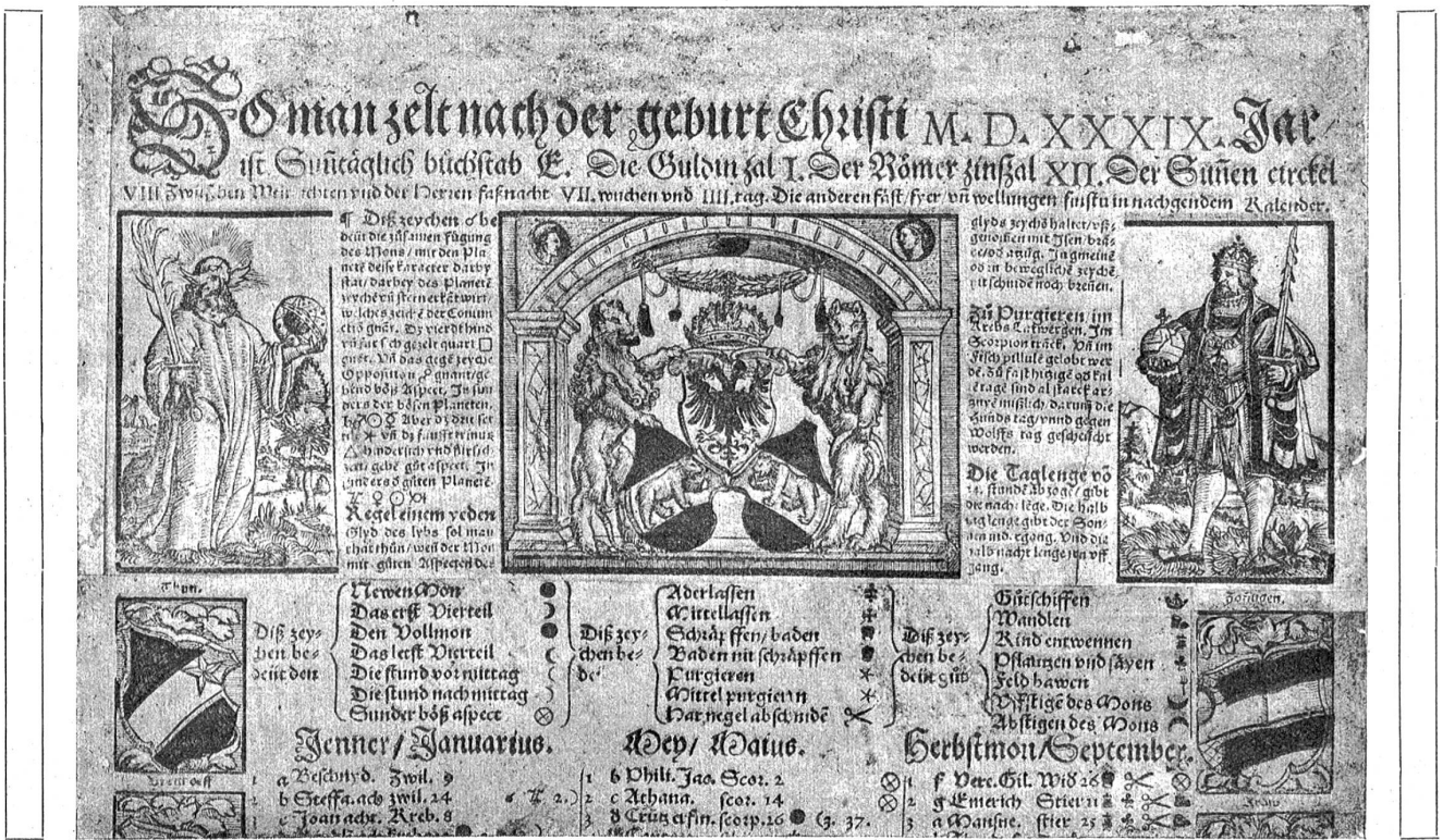
Bernischer Kalender von 1539 in der Stadtbibliothek, laut beigelegter Angabe vom Stadlarzt Val. Anshelm aufgestellt und von Apiarius gedruckt.

diesem Saale sind die Vitruvini und Wände gefüllt mit Kuriosa des schweizerischen und ausländischen Buchgewerbes.