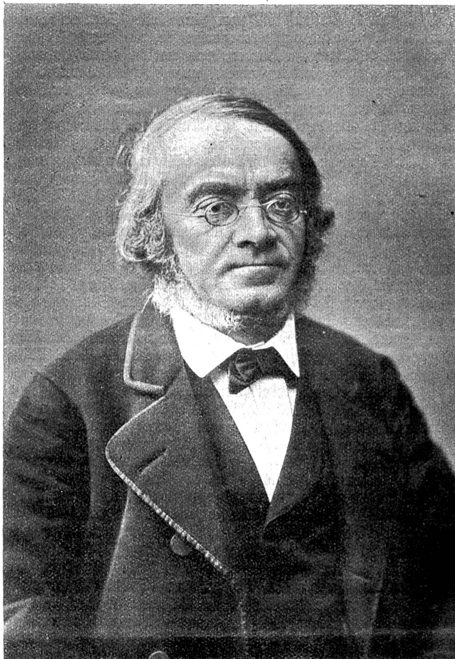
Theodorich v. Verber. (Phot. Vollenweider, 1880.)

In jene Jahre fällt die Gründung des Jünglingsvereins durch Verber und seinen Freund Heinrich von