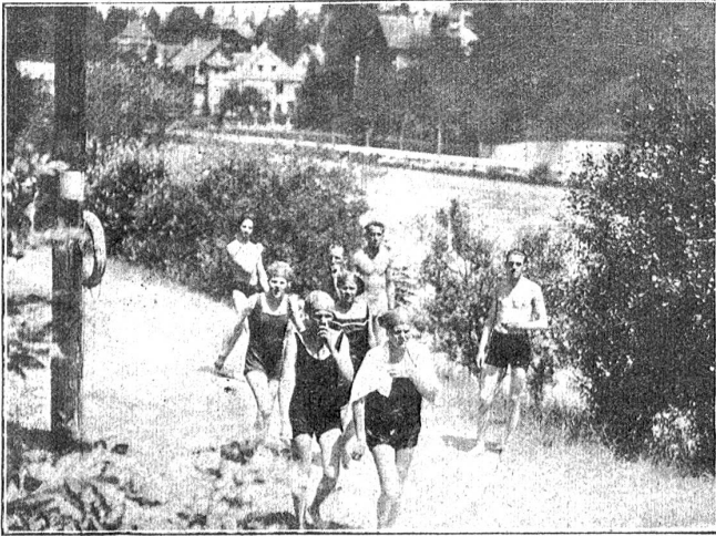
Auf dem Marenstrandweg.