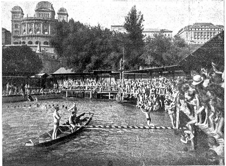
Ein Schwimmgamen im „Bubenseit“.

„Das ist am End' des Lebens Lauf: Man sinkt und steigt, und steigt und sinkt, So lange, bis der Tod uns winkt!“ Die alten Weiden dachten das,