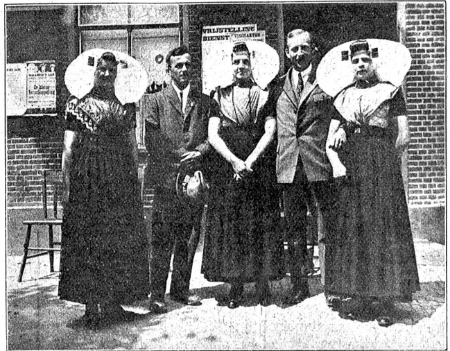
Die holländische Frauentracht in der Provinz Zeeland.

Bekannt ist das Sprichwort: „Gott hat die See, wir haben die Küste geschaffen!“ Die Hälfte des Bodens hat der Holländer in zähem Kampfe dem Wasser abgerungen. Die trocken gelegten Meeresteile oder Sumpfgenden nennt man Polder. Die meisten Polder liegen tiefer als der Meerespiegel, in der äußerst fruchtbaren Provinz Nordholland z. B. vier bis fünf Meter, stellenweise sogar acht Meter. Gegen die Nordsee schützen hier gewaltige Dünen das Land, gegen die Zuidersee mit ihrer starken Brandung feste Dämme. Die erste großzügige Entwässerung erfolgte von 1608—1612 im Beemster Polder, den wir besucht haben. Zuerst wurde hier das Binnenmeer, das weiland sehr fischreich war, mit einem starken Ringdeich (Damm) umgeben und dann das Wasser des Sees in den Ringkanal gepumpt, von hier ins Meer abgeleitet. Diese Arbeit besorgten 40 Windmühlen. Im entwässerten Gebiet wurde sodann ein Hauptkanal, höher gelegen als das Kulturland und daher mit starken Dämmen geschützt, erstellt. Die eigentliche Entwässerung erfolgt durch Seitenkanäle. Von diesen wird das Wasser in den höheren Hauptkanal gepumpt, der mit der Nordsee und der Zuidersee in Verbindung ist. Starke Schleusen verhindern das Eindringen des Meeres und leistungsfähige Dampf-wasserhebwerke mit Zentrifugalpumpen und ein Dieselmotorwerk befördern das überflüssige Kanalwasser ins Meer.