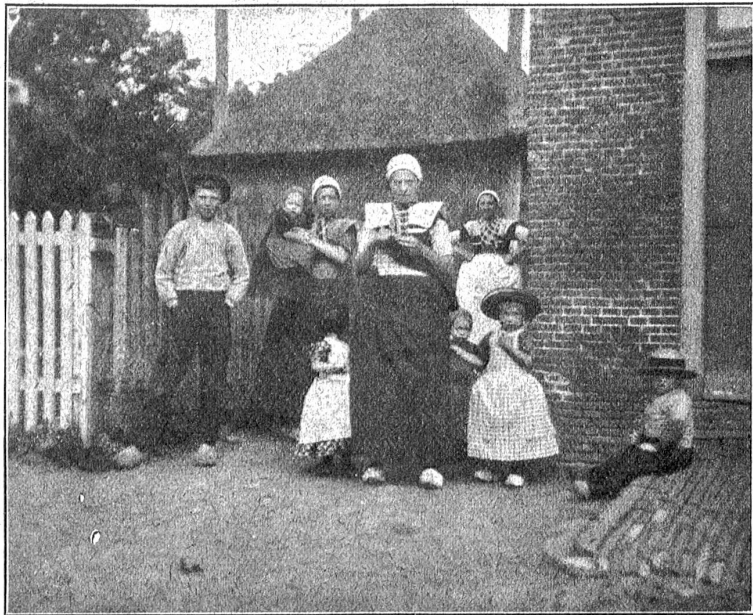
Volksgruppe aus einem holländischen Dorfe.