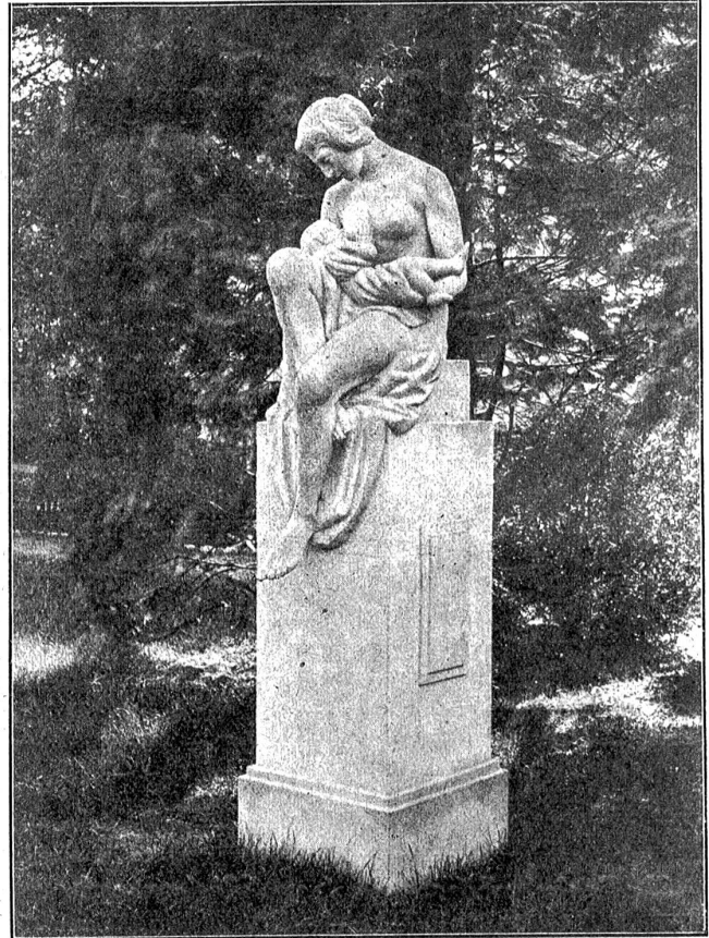
„Mutterliebe“ von Karl Häny.

Es gelang ihm bald darauf, einen bedeutenden Posten in der Verwaltung einer Ceyloner Teeplantage zu erhalten, wodurch er auch pekuniär weit besser gestellt wurde als es an seinem frühern Platze in Madras der Fall gewesen war. Es kam ihm zum Bewußtsein, daß er jetzt mit einem Mal dem Ziel seines äußern Strebens näher gerückt sei, nachdem er das innere Ziel, die Erfüllung seiner Liebe, verloren habe. Er geriet über derlei Dinge, ohne jedoch von seinen persönlichen Erfahrungen auch nur andeutungsweise zu reden, mit einem schwarzwaldischen Missionar, der hier der Heidenbekehrung oblag, in lange Gespräche. Der Mann