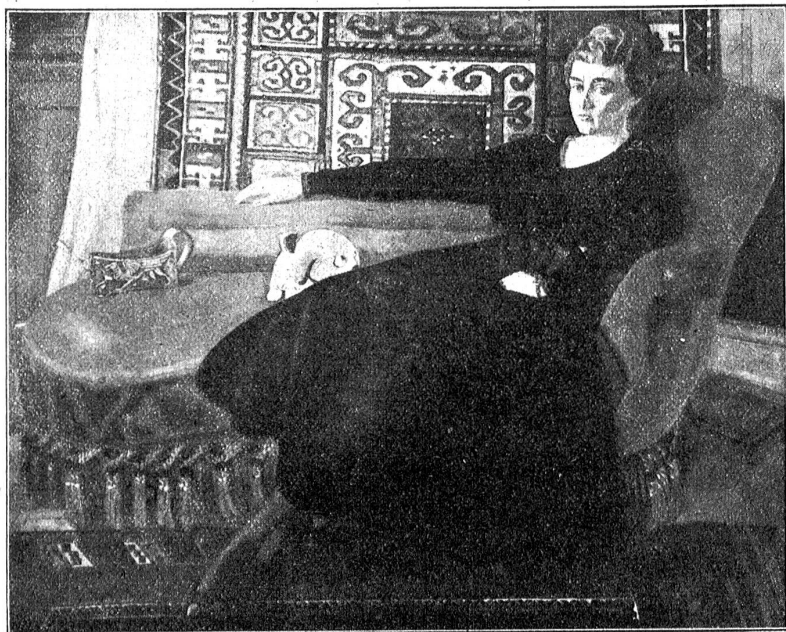
Gottfried Christen. Damenporträt. 1917. (In Tempera.)

Schaudernd bedeckt es beide Augen mit den Händen; aber das gramverzehrte Gesicht wird deutlicher, größer und dunkler sind die Augen und blicken es drohend an. Jetzt steht er unterm ewigen Licht vor seiner Bahre, eine Hand streckt er aus, die andere trägt das Kreuz, er kommt näher; aber das sind nicht Friedlis Augen, so groß und flehend. So streckt er die Hand, als ob er sich wehren müht vor ihm: „Du, was tust du mir in meiner Totenruhe! So laß mich rein, du, vor den Leuten!“