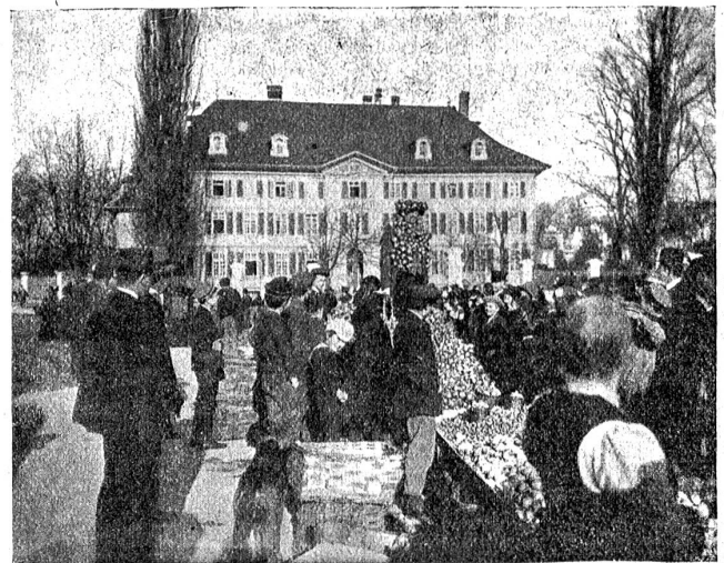
Der Ziebelemarkt auf dem Waisenhausplatz in Bern.

D'Geisle fat a chlepfe; „Hü Schümu, zieh brav!“ Adio! Adio! u mit Lärme verschwindet das Gfähr über das holperige Pflaschter d'Brunnghä ab. Alles luegt ne mache, däm glückliche Paar, die ihres Zämecho u ihres Glück einzig und allei d'm hütige Tag, d'm Chachelmarit z'verdanke hei.