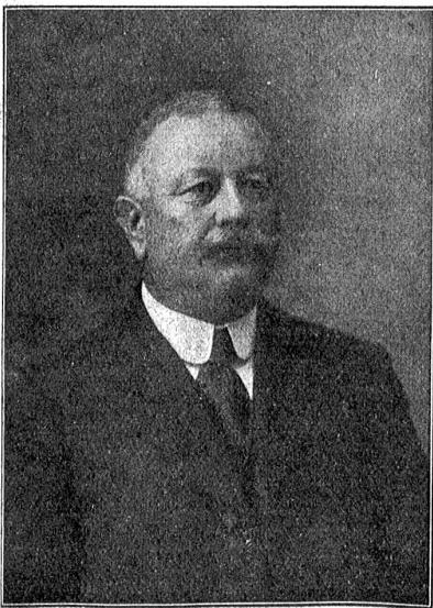
Raymond Evéquoz, der neue Nationalratspräsident.