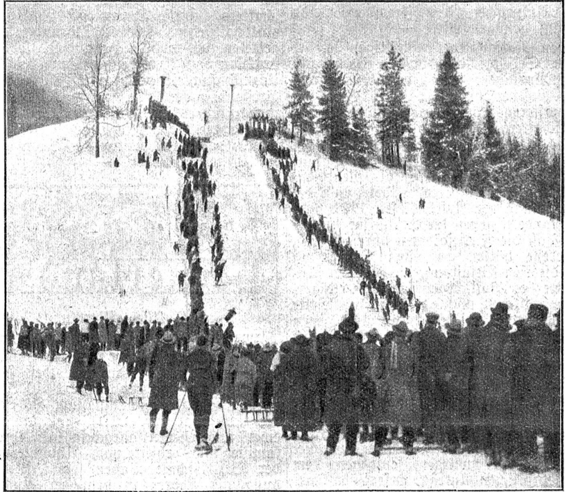
XVII. schweizerisches Skirennen in Grindelwald.

Die nationalrätliche Zolltarifkommission beschloß mit allen gegen drei Stim-