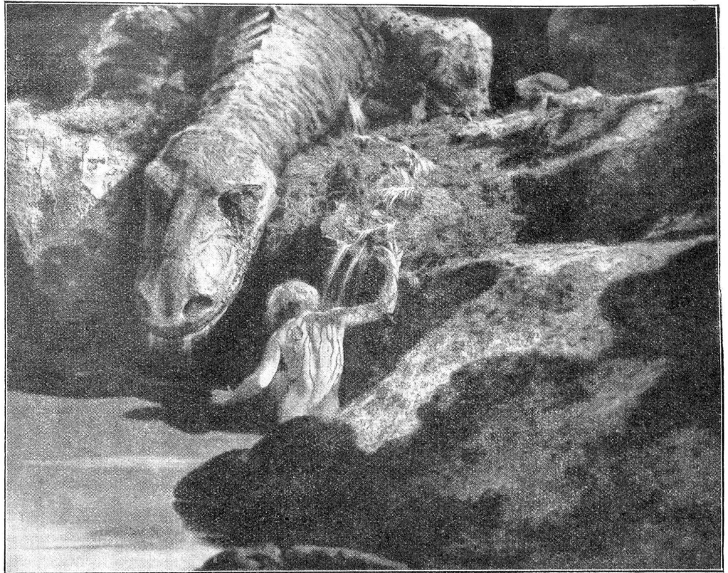
Siegfried badet sich im Blut des erschlagenen Lindwurms.

Die Uganda - und Aschanti -Neger opferten bis