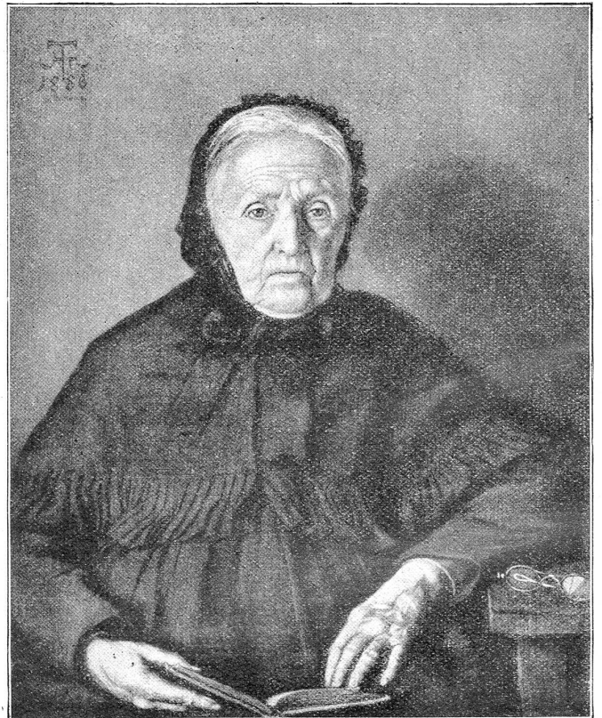
Hans Thoma: Bildnis der Mutter des Künstlers.