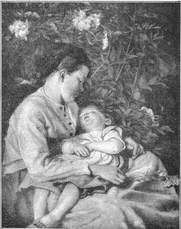
Hans Thoma: Unter dem Sieder.

„In solcher Stimmung (um es kurz anzudeuten: in der Stimmung des Weltsehmerzes auf der Suche nach dem verlorenen Paradies) ging ich einst durch den sonnigen Tag dahin, ich kam an einem Garten, in dem ein im Innern fast verstecktes Häuschen war — ich blieb vor dem Tore stehen, denn aus diesem Garten erschollen seltsame Töne, so daß ich nicht wußte, soll ich mich nahen, soll ich fliehen. Etwas von einer Menschenstimme glaubte ich zu hören — aber es war ein Geplapper: ra ra ra la la la ri ro, ni o a la ma mu ma ba sa ja — dazwischen quiekte es wie ein junges Schweinchen, dann hörte ich Töne wie man sie anschlägt, wenn man sich über etwas höchlich verwundert: ah, uh, uh oh oh ih ih