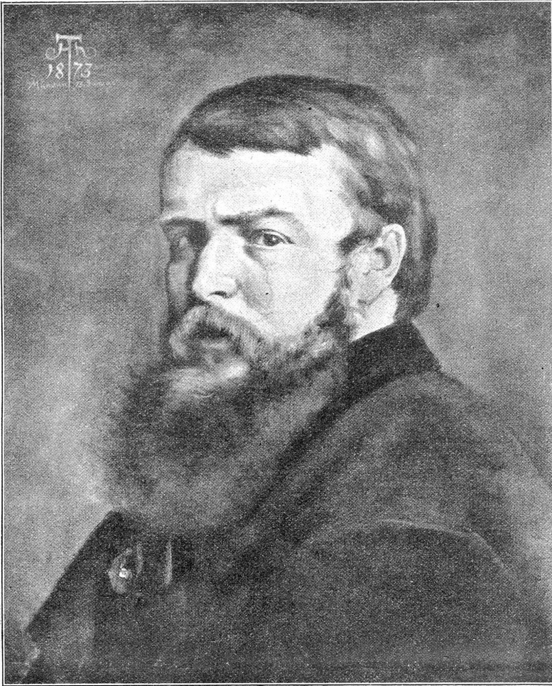
Hans Thoma: Selbstbildnis (1873).