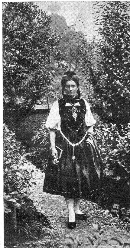
Solothurner Tracht um 1830.

Die Solothurnertracht zeichnet sich durch eine geschmackvolle Schlichtheit aus. Schwarze Bantöffelchen, weiße Strümpfe, gefältete Juppen aus Leinen oder Wollstoff, schwarz bei Frauen, rot oder braun bei Töchtern, farbig besticktes und mit Sammetbändern eingefasstes Mieder und eine sogenannte Schnabelhaube als Kopfbedeckung, das sind die Hauptbestandteile der Tracht. Nicht zu vergessen, weil zur Solothurnertracht notwendigerweise gehörend, die beiden Schmuckstücke, das sogenannte „Dehli“, ein Anhänger aus feiner Filigranarbeit mit einem von farbigen Steinen umrahmten Medaillon — ursprünglich ein Amulett mit Heiligenbildchen, später ein Medaillon mit Miniaturporträts — das an der Halskette vor die Brust gehängt wird; ferner die Brautgürtel aus Silberspangen mit Hänger, die um die Taille und Hüfte getragen werden, wie unsere Abbildung zeigt. Die Solothurnertracht ist schmutz und kleidsam und verdient es zweifellos, wieder zu neuem Leben erweckt zu werden.