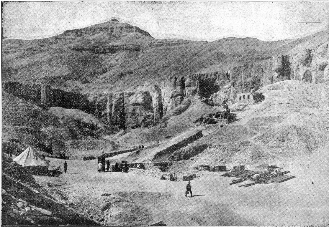
Das Tal der Könige bei Luxor. (X bezeichnet den Eingang zum Grab des Tutanchamon.)

in einem zweiten Raum, dessen Inhalt dem des ersten entsprach, und an einer anderen Stelle in einen Doppelraum. Dieser dritte und vierte Raum, die durch eine offene Türe miteinander in Verbindung stehen, bergen erst die sterblichen Reste des Königs. (Schluß folgt.)