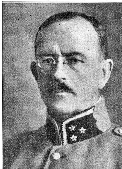
Oberst Hans Frey,

Im Ständerat wurde erst die Staatsrechnung erledigt und hierauf die Opiumkonvention nebst dem dazugehörigen Gezet über die Betäubungsmittel gutgeheißen. Auch brachte er noch das Gezet über die Sprengstoffe zu Ende und begann mit der Beratung des neuen Zollgesetzes.