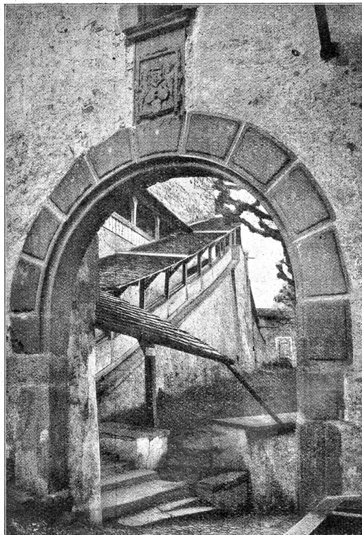
Aufgangstreppe zum Schloss Laupen. Aufgenommen 1908.

Graf Rudolf, ein hochgewachsener Mann mit Adlernase, tapfer, schlau und zähe, stritt in jungen Jahren für den Kaiser, gegen den Papst, wurde aber später fromm, als