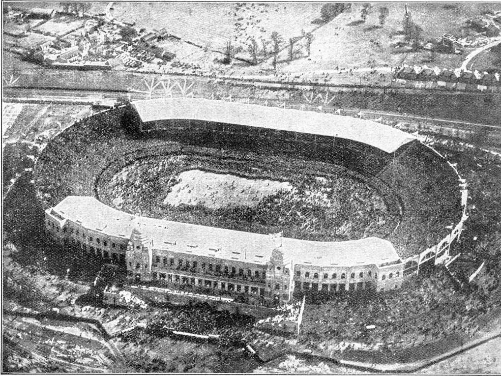
Das Riesen-Stadion in Wembley (Sliegeraufnahme), das aus Anlaß der britischen Reichsausstellung erbaut wurde, während eines Besuches von 125,000 Personen.

Rasse. Unsere farbigen Brüder haben Europa — und insbesondere England — die in mancher Hinsicht etwas zweifelhaften Wohltaten der Zivilisation, die ihnen der „weiße Mann“ gebracht hat, nicht unerwidert gelassen. Sie haben sie bezahlt, zum Teil recht teuer bezahlt.