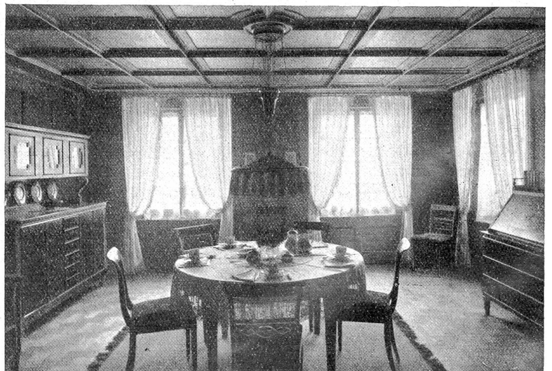
Blick gegen die Fenster.

So muß gerade die Stadt ihre Sünde wieder gutzumachen suchen. Die bernische Vereinigung für Heimatschutz möchte mit ihrer Visitenstube einen Vorschlag machen, wie man im Bauernhause einen freundlichen Raum schaffen kann, in den sich die Meisterleute auch in ihren Alltagskleidern hineinwagen. So würde der nur bei großen gesellschaftlichen Ansprüchen nötige und im einfachen bürgerlichen oder bäuerlichen Heim gänzlich überflüssige „Salon“