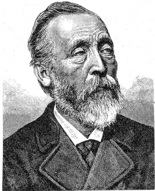
Heinrich v. Stephan, erster deutscher Generalpostmeister, der die Gründung des Weltpostvereins mit aller Energie anstrebte.

Stand“, d. h. die Korporation der jungen Berner Patrizier, als deren Rathhaus erbaut worden ist, und das 1798 als Versammlungsort der Tagsatzung, dann des