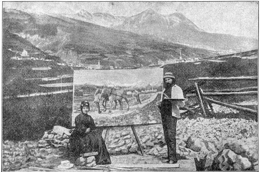
Der Maler Giovanni Segantini mit seiner Gemahlin.

Seine Zumutung kam mir zu gemein vor, als daß ich ihm darauf hätte Bescheid geben können; ich ging ohne weiteres meiner Wege. Das Zwänggeld werd' ich ihm dann