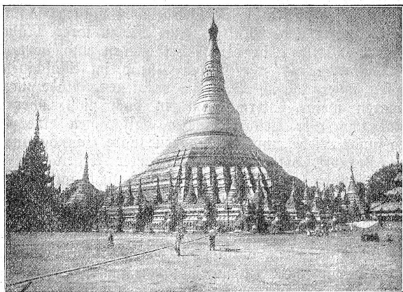
Schwe-Dagon Pagode zu Rangun, Birma.

es einzurichten, daß Siddharta einen Aussätzigen und einen Toten erblickt, trotz der Wachen. Das verändert den Sinn des Prinzen, der Frau und Kind verläßt, um in der Ein-