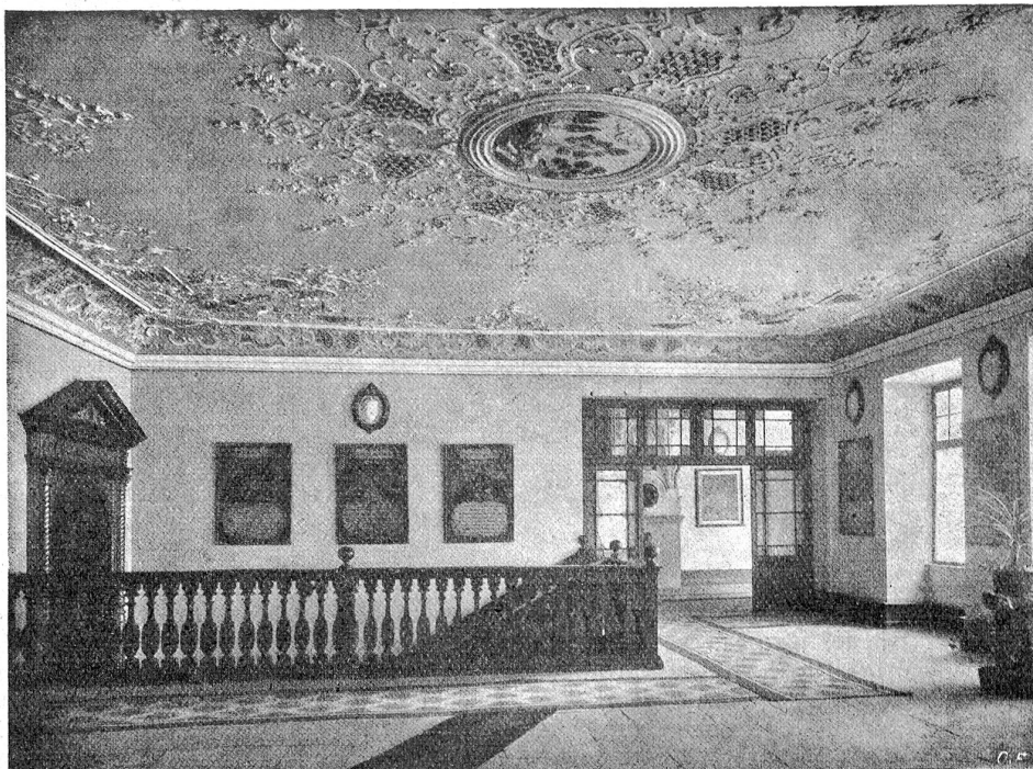
Das Creppenhaus im 2. Stock des bischöflichen Schlosses in Chur.

Bekanntlich ist Chur noch heute Bischofsitz. Zum Bistum Chur gehört außer dem Kanton Graubünden auch der Kanton Schwyz. Die Stadt selbst, so sehr der bischöfliche Palaß und die anschließende Domkirche das Stadtbild beherrschen, hat ihre Entwicklung in ganz anderer Richtung genommen, als das bei einer bischöflichen Residenz zu erwarten ist. Das St. Gallen Badians darf hier als Vergleich dienen. Ein reger freier Geist beherrscht das Erwerbs- und Geistesleben. Daß sich die junge Generation nicht zu sehr dem traditionslosen Weltbürgertum hingibt und einer wurzellosen Bauerei verfällt, dafür sorgt im Bündnerland eine tatkräftige Heimatschutzbewegung. Diese findet nicht zuletzt in Werken wie das vorliegende, die hinweisen auf das Schöne und Zweckmäßige aus vergangenen Bauepochen, die Anregungen und Impulse. Das großangelegte Sammelwerk „Das Bürgerhaus in der Schweiz“ — es sind bis heute vierzehn Bände erschienen — verdient schon aus diesem Grunde die Beachtung des Schweizervolkes. H. B.