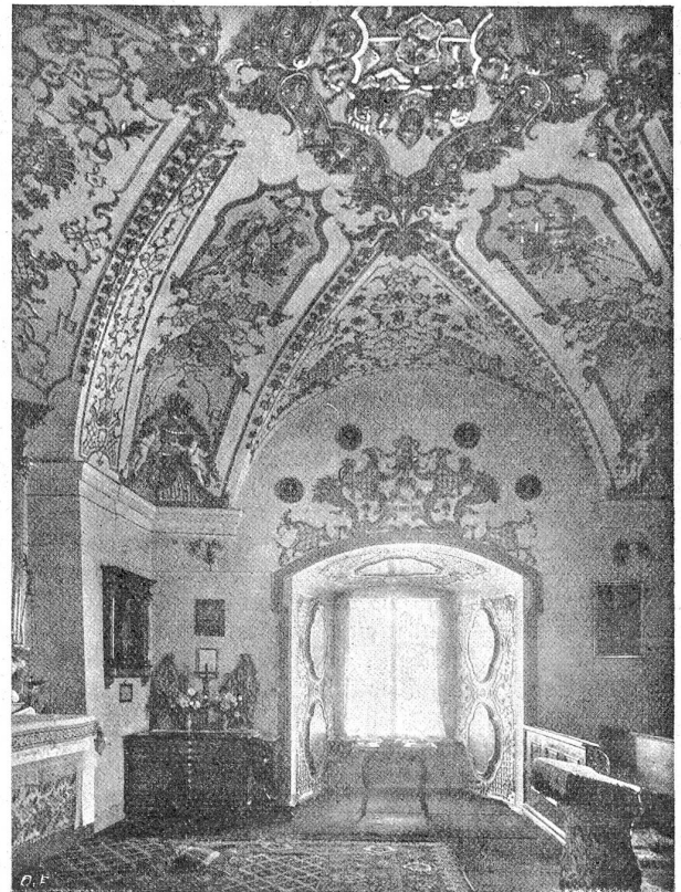
Die Kapelle im bischöflichen Schloss in Chur.

Aus der Zeit, da der Graubündner anfing, die Welt als Heimat zu betrachten, stammt manch prunkreiches Renaissance-Getäfel mit strengen, säulenbetonten Türfassungen und schweren Facettendecken. Und als es die Bündner in der Weltpolitik so weit gebracht hatten, daß sie um ihrer