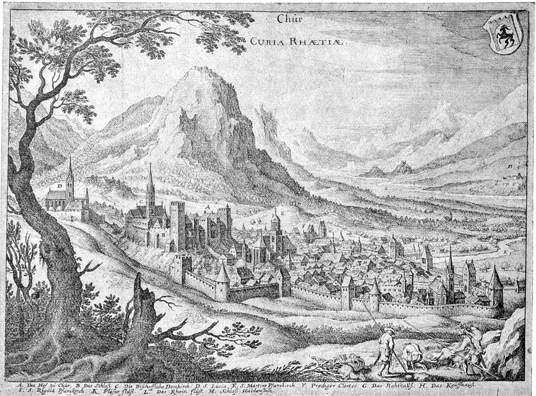
Ansicht der Stadt Chur von Merian.