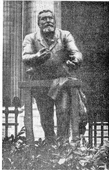
Das Denkmal Saurès vor dem Panthéon.

Jugendverbände und Sportvereinigungen. Besonderes Aufsehen erregte der Sonderzug von 15,000 Kommunisten unter Führung von Cachin und Loriot.