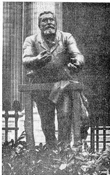
Das Denkmal Jaurès vor dem Panthéon.

Jugendverbände und Sportvereinigungen. Besonderes Aufsehen erregte der Sonderzug von 15,000 Kommunisten unter Führung von Cachin und Loriot.