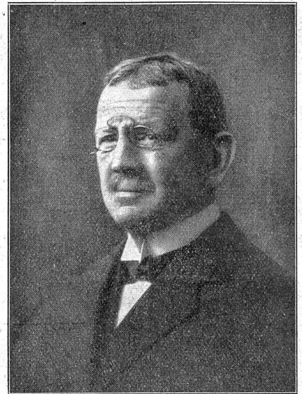
Bundesrichter Dr. H. Engeler.

Die letzten Mitteilungen des eidgenössischen Veterinäramtes über die Maul- und Klauenseuche verzeichnen an neuen Fällen in sechs Ställen 51 Stück Rindvieh und neun Schweine. Damit steigt das Total auf 27 Ställe (wovon 11 im Kanton St. Gallen und 13 im Kanton Graubünden) mit 217 Stück Rindvieh, 32 Schweinen, 26 Ziegen und drei Schafen.