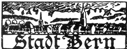
† Werner Goldschmid.

Der Regierungsrat beantragt dem Großen Rat eine weitere Vereinfachung der Staatsverwaltung in dem Sinne, daß in denjenigen Amtsbezirken, in denen die Amtsverrichtungen des Regierungstatthalters dem Gerichtspräsidenten übertragen sind, die Amtsverrichtungen des Betreibungsbeamten dem Gerichtsschreiber überbunden werden. Der Große Rat soll ermächtigt werden, die Vereinigung dieser beiden Amtsstellen auch für andere Amtsbezirke zu beschließen, soweit dies ohne Nachteil für die Erledigung der Geschäfte geschehen kann.