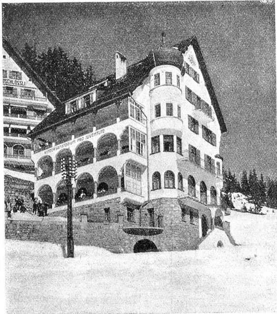
Kindersanatorium Pro Juventute in Davos-Platz.

Für Erholungsaufenthalte von tuberkulosegefährdeten Kindern kommen Familien-Freiplätze fast nicht in Betracht, einerseits wegen der Ansteckungsfurcht der Familie, andererseits