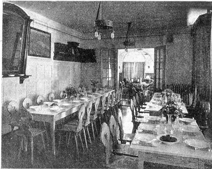
Speise- und Spielsaal im Kindersanatorium Pro Juventute in Davos.