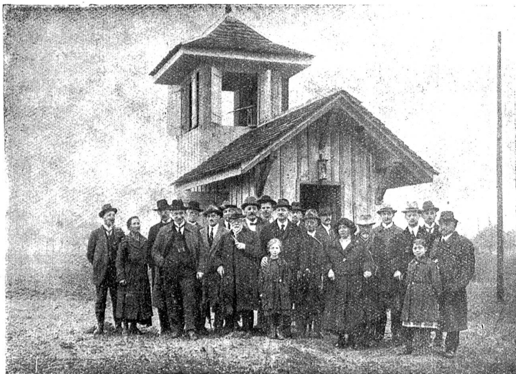
Beobachtungshäuschen der Vogelwarte in Sempach von der Schweiz. Gesellschaft für Vogelkunde und Vogelschutz

Bern aus ihre Tätigkeit bemerkbar gemacht. Die Beringung allein bietet schon ein großes Betätigungsfeld.