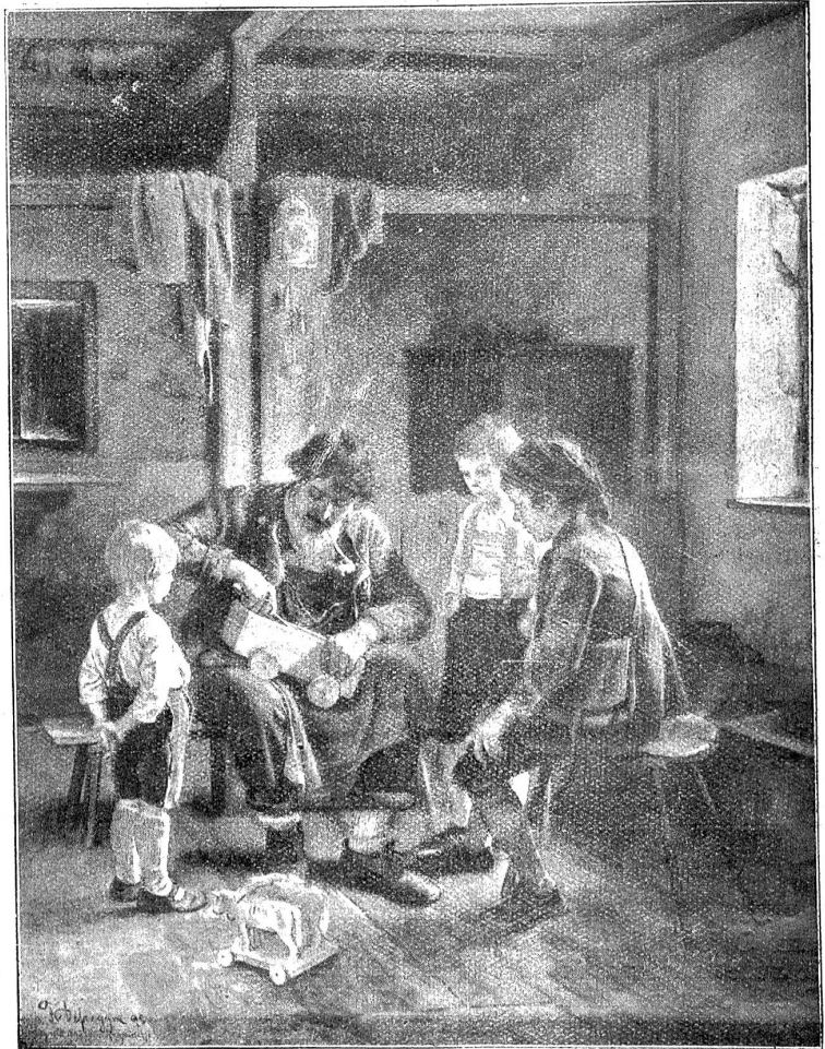
Franz Defregger: Das neue Wägelchen.

Er ergab sich darein und sagte sich, daß Susanna nach