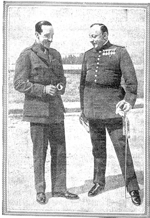
König Alphonso von Spanien in einer Unterredung mit dem Diktator Primo de Rivera.

uns anzuschließen, eingebüßt.“ Wie Italien kommt auch Spanien mit seinen Faschisten und seinem Diktator kaum zum guten Ende.