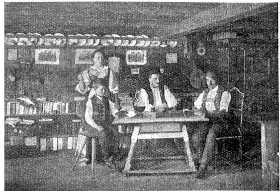
In der Ahnenstube (Coggenburg).

lichen Sohlen durch das Haus huscht und niederkauert in jedem Winkel der freundlichen Wohnung. Meta wird immer wirrer und angstvoller zumute. Wenn ihr nur wer