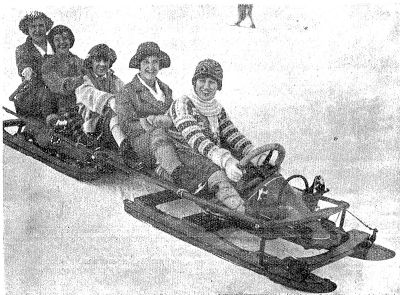
Studentinnen aus Oxford vergnügen sich beim Bobsleighsport.

Heute scheint dieses Spiel eine kleine zweite Auflage erhalten zu wollen. Die Türken haben in ihrer brutalen Art gegen alle Abmachungen und Vertragsbestimmungen den Patriarchen von Konstantinopel ausgewiesen. Dieser ist das höchste geistliche Haupt der griechisch-katholischen Kirche; er ist gewählt von den 19 Metropolitane und hatte seit jeher seinen Sitz in Konstantinopel, der ersten Metropole des Christentums. Die Griechen protestierten, mit ihnen die Orthodoxen in Bulgarien, Serbien und Rumänien. Sie erhielten aus Angora höhnisch kalten Bescheid. Die Türken stützen sich auf einen Entscheid der Auswanderungskommission, in der sie aber in der Mehrheit sitzen und der einen Unterschied macht zwischen der Person des Patriarchen — die unter das Auswanderungsgesetz falle — und dem Amt