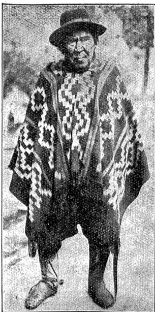
Chile: Ein alter Ranchoero (Bauer) im Sonntagsstaat.

Alle haben sie denselben Beruf. 7—9jährige Knaben, schulfrei, mit einem Puzkasten über der Schulter — Schubpuher. Dazu sind sie Gepäckträger, Zeitungsverkäufer, Fremdenführer, besorgen Einkäufe usw. Auf dem Markte stehen sie mit Körben auf dem Kopfe. Man winkt ihnen,