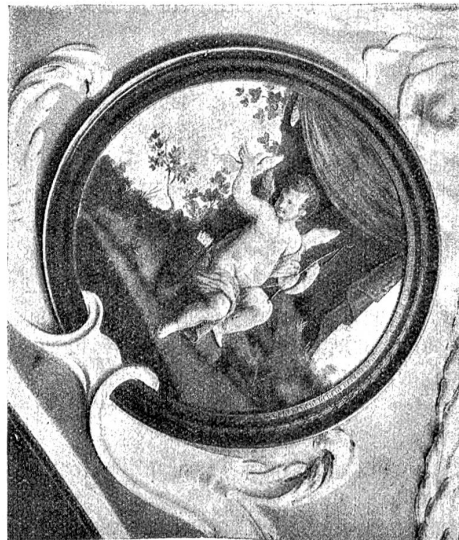
Schloss Reichenbach. — Deckendetail.

Die „Post-Fischer“ sind zweifellos durch das Postregal reich geworden. Denn der Pachtzins blieb über hundert Jahre lang der gleiche, während der Verkehr sich gewaltig entwickelte und dem entsprechend die Einnahmen wuchsen. Erst 1793 wurde die Pachtsumme erhöht und zwar auf