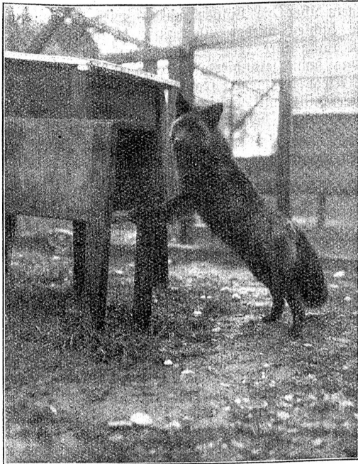
Ein acht Monate alter schöner Fuchs vor dem Eingang in seine Behausung in den Gehögen des Rud. Ingold-Babic, Herzogenbuchsee.

Das einzige Tier, welches bis heute zu seiner Selbsterhaltung in Domestikation gebracht worden ist, ist der Silberfuchs. Trotzdem die Zivilisation und die Kultur des Menschen mit ihrer Zerstörungswut in die Wälder und Schlupfwinkel der Tiere immer weiter vorgedrungen ist, hat bis kürzlich niemand daran gedacht, die wertvollen Pelzträger, die unabweisbar der Ausrottung anheim gefallen wären, durch Züchtung in Gefangenschaft zu erhalten. Zu jeder Zeit wurden wilde Tiere, also auch Füchse, welche wild gefangen wurden, in einzelnen Individuen für längere oder kürzere Zeit am Leben gehalten, sei es zu Studienzwecken, sei es als Kuriosität oder zum Vergnügen.