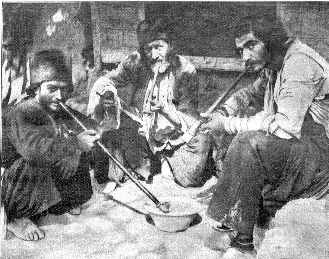
Opiumraucher mit ihren Pfeifen nebst Holzkohlensänge, Kohlenbecken und den Holzbänken, auf denen die Raucher ihren dumpfen Rausch ausschlafen.

Das Opium wird zum Zwecke der Berausung sowohl gekaut als geraucht. Das Opiumessen wird bei den Türken geübt. Die Opiumesser sind blasse, abgekehrte Gestalten mit gestrecktem Hals und gereckten Gliedern, erstorbenen Augen und stammelnder Zunge. Sie setzen sich auf Sofas längs einer hölzernen Galerie. Jeder schluckt die ihm zusagende Zahl von Pillen mit einem Glas Wasser; binnen einer Stunde sind sie dem beseligenden Rausch des Opiums hingegeben, der ihnen die Wünsche ihrer