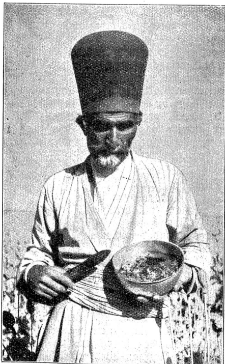
Der Ertrag von etwa einem halben Morgen Land, innerhalb drei Stunden gesammelt.

Das Opiumlaster ist längst keine bloß orientalische Erscheinung mehr. Es gibt in New York, London und Paris Opiumlokale, wo sich willenlose Menschen zugrunde richten, sogar wie in Kanton oder Schanghai. Zwar wird das Opium in den europäischen Großstädten mehr und mehr durch das nicht weniger gefährliche Kokain verdrängt, so daß man bei uns mehr von „Kokainhöhlen“ liest als von „Opiumhöhlen“. Es scheint ein Angebinde feindlicher Gottheit zu sein, daß der Mensch, wenn er die Welt mit ihren Unvollkommenheiten vergessen und sich in ein überirdisches Glück hineinträumen will durch das Mittel des Rausches, dies mit seinem Menschentum oder gar mit dem Leben zahlen muß. Glückliche die Menschen, die den Rausch nicht nötig haben, weder in dieser noch in jener Form!