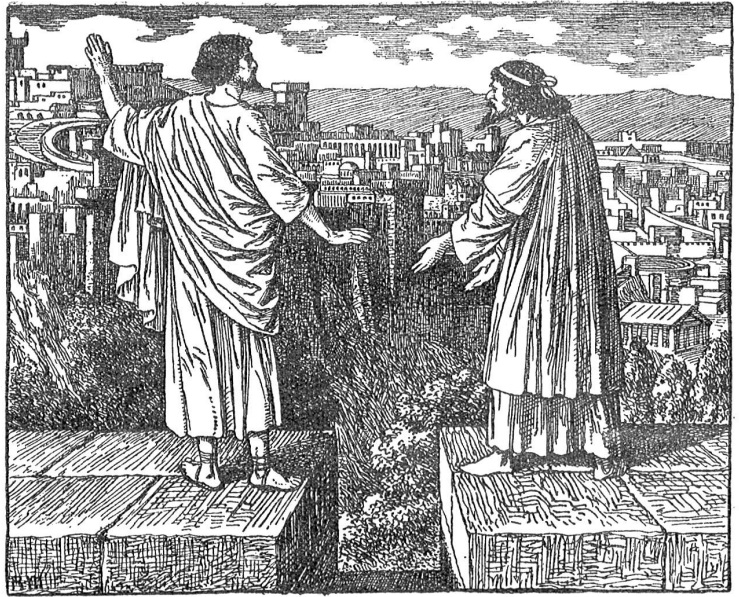
Jesus in der Versuchung.

Mürger kennt die Bibel und die Vorstellungswelt, die die Tradition aus ihr aufgebaut hat. Das beweisen die 80 Illustrationen. Sie verraten auch, daß er sich ein eingehendes Studium der biblischen Landschaft und Kultur nicht verdrießen ließ, um dem Geist der zu illustrierenden Erzählungen ganz gerecht zu werden. Denn auch das Sachliche gehört zum Verständnis des biblischen Geistes. Je vertrauter einem die Dinge sind, umso lieber sind sie einem; und Liebe schafft die Bereitschaft zur Aufnahme des Geistigen, das aus den Dingen strömt. So hat, glauben wir,