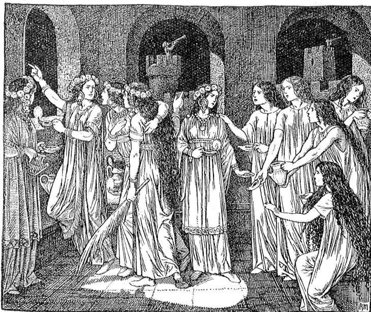
Die klugen und die törichten Jungfrauen.

Wir müssen immerlich ein wenig an uns arbeiten und suchen, milder in unserm Urteil, anspruchsloser in unsern Forderungen zu werden. Wir müssen anfangen, die Leute zu nehmen wie sie sind, und zur Erleichterung der Arbeit immer eingedenk sein, daß es in Nord und Süd, West und Ost immer wieder die alte Geschichte ist, und daß wir selber die Fehler teilen, die wir an andern rügen und verdammen. Theodor Fontana.