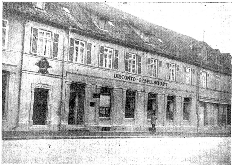
Zum 50. Codestag des Dichters Eduard Mörike. — Mörikes Geburtshaus in Ludwigsburg.