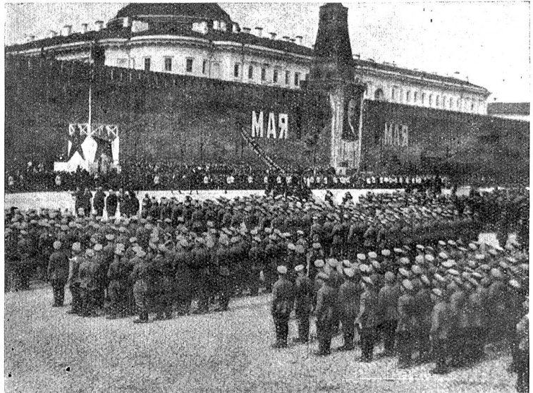
Eine Militärparade vor dem Grabmal Lenins auf dem Platze vor Lenins Grab in Moskau.

Da lief die Tochter fröhlich mit Eile hinauf, ein rein Leintuch zu holen, brach' es und half ihr aus dem Kasten steigen; das tat sie sonder Müh und lachenden Mundes. Flugs schlug ihr die Dirne das Tuch um den Leib und führte sie bei ihrer Hand eine schmale Stiege hinauf in der hintersten Ecke des Kellers, da man durch eine Falltüre oben gleich in der Töchter Kammer gelangt. Allda ließ sie sich trocken machen und saß auf einem Stuhl, indem ihr Tutta die Füße abrieb. Wie diese ihr nun an die Sohle kam, fuhr sie zurück und fischerte. „War's nicht gelacht? frug sie selber sogleich. — „Was anders?“ rief das Mädchen und jauchzte: „Gebenedeiet sei uns der Tag! ein erstes Mal wär' es geglückt!“ — Die Wirtin hörte in der Küche das Gelächter und die Freude, kam herein, begierig, wie es zugegangen, doch als sie die Ursach vernommen — du armer Tropf, so dachte sie, das wird ja schwerlich gelten! — ließ sich indes nichts merken, und Tutta nahm etliche Stücke heraus aus dem Schrank, das Beste was sie hatte, die Hausfreundin zu kleiden. „Seht!“ sagte die Mutter, „sie will wohl aus Euch eine Susann Preisnestel machen.“ — „Nein“, rief Lau in ihrer Fröhlichkeit, „laß mich die Aschengruttel sein in deinem Märchen!“ nahm einen schlechten