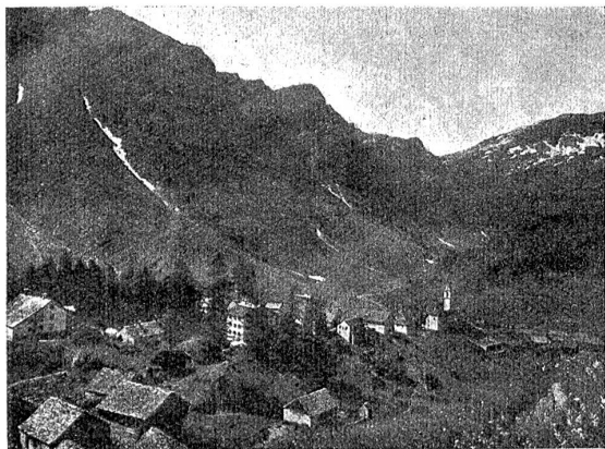
Das arme Lawindorf Bosco (deutsch Gurin), das ständig von Lawinen bedroht ist und im Februar in seinem untern Teil verschüttet wurde. Eine Hilfsaktion ist eingeleitet.

Siedlung, und es ist ihm, Heimat müsse kommen jetzt, herz-warme Heimatlichkeit. Man muß wissen, daß die Guriner