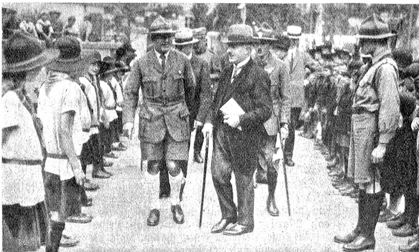
Bundesrat Motta bei den Pfadfinderinnen.