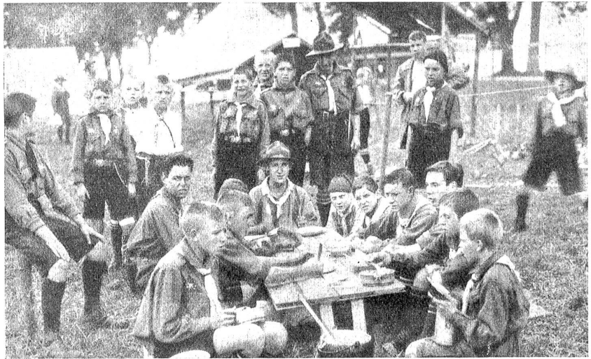
Erstes schweiz. Pfadfinderlager in Bern. Lager-Tagll.

So gegen 3 Uhr ging's dann los, durch die Gerechtigkeitsgasse u. bis zum Bundesplatz. Es war etwas bunt, das ist ja richtig. Sehr viel Drüll lag nicht im Zuge, wer Pfeifer oder Trommler hatte, stellte sie an die Spitze,