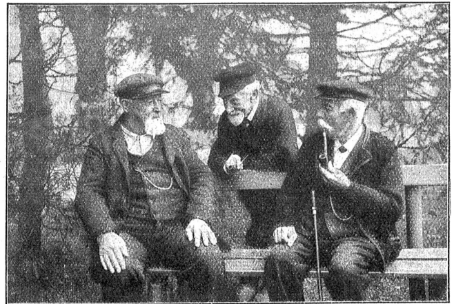
„Und druf abe hani gseit . . .“

mir Qual und Not. Es gab Tage, wo ich nur diesen einen Weg sah, wo ich die Heimat und die Meinen als Hemmnungen in meinem Leben fühlte, wo ich die Kraft empfand, alles, was mir hindernd in den Weg trat, bei Seite zu stoßen. Aber wer würde dann für meine alte Mutter und meine kranke Schwester sorgen? Das Band, das mich mit ihnen verband, war stark, und ich wußte, daß ich nie Frieden finden würde, wenn ich es zerriß und meine eigenen Wege ging. Ich konnte mir allein nicht helfen und wandte mich in meiner Not an Frau Joachim, legte ihr die Sache dar, auch meine Zweifel an meiner Befähigung für das Künstlertum als Lebensberuf und bat sie um ihren Rat. Sie kannte mich und liebte die Meinen, außerdem war sie nicht nur eine große Künstlerin, sondern auch eine warmherzige Frau, sie würde meinen Kampf verstehen und mir zur Klarheit helfen.