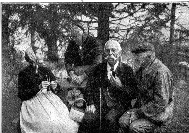
„Mir längwilen-is nid.“

Ich hatte gedacht, daß mein Entschluß feststünde und hatte nur einen Weg vor mir gesehen, der führte in die Heimat und in den Lehrerberuf, in ein Leben voll mühsamer, wenn auch reichlicher Arbeit für meine Mutter und meine Schwester. Und nun kam dies Anerbieten, riß die Tore auf und zeigte mir lockend eine Welt voll Glanz und Schimmer. Sorglos studieren dürfen und dann ein Leben „auf der Menschheit sonnigen Höhen“! Ich war jung, und das Künstlertum in mir war stark und machte