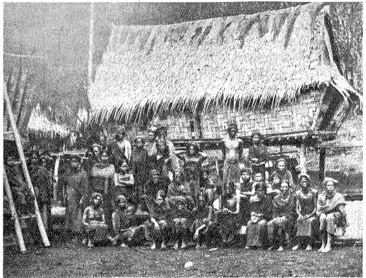
Bevölkerung eines Malayenkampong.