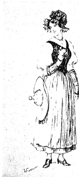
Waadtländerin in ihrer Tracht.

Besondere Beachtung verdient die Gruppe Obst- und Weinbau. Ebenso der Pavillon über Bienenzucht. Die rühmlichen Beileger aus allen Gauen unseres Landes bieten mit viel Geschmac ihr Bestes. Einen mächtigen Eindruck hinter-