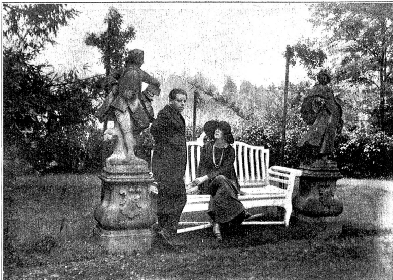
Professor Max Reinhardt auf seinem Schloss Leopoldskron bei Salzburg.

Der berühmte deutsche Regisseur war zuletzt Direktor des Josephstädter Theaters in Wien. Diesen Herbst leitet er die Salzburger Festschpiele. Kürzlich war er im hiesigen Operntheater mit seinen Salzburger Mitarbeitern zu Gast. Obiges Bild zeigt ihn mit Lady Diana Manners, der Hauptdarstellerin des „Mirakel“ im Garten von Leopoldskron.