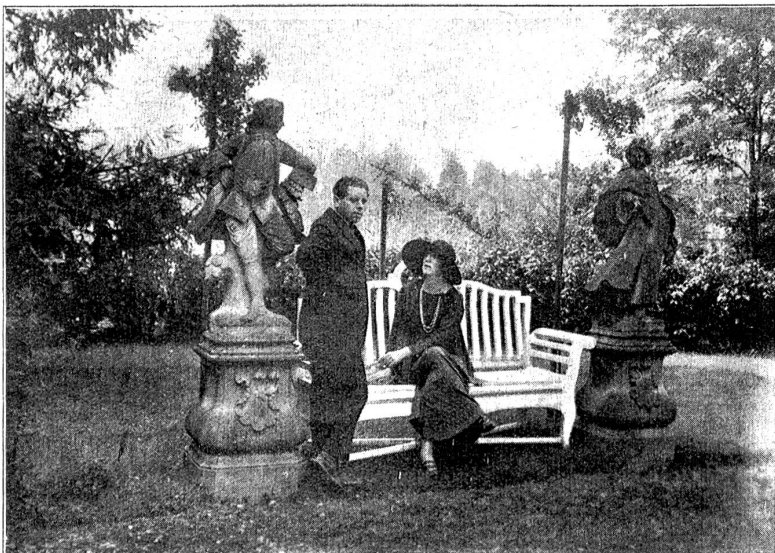
Professor Max Reinhardt auf seinem Schloss Leopoldskron bei Salzburg.

Der berühmte deutsche Regisseur war zuletzt Direktor des Josephstädter Theaters in Wien. Diesen Herbst leitet er die Salzburger Festschpiele. Kürzlich war er im hiesigen Operntheater mit seinen Salzburger Mitarbeitern zu Gast. Obiges Bild zeigt ihn mit Lady Diana Manners, der Hauptdarstellerin des „Mirakel“ im Garten von Leopoldskron.