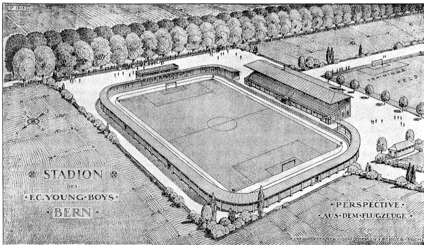
Das „Stadion Wankdorf“, der neue Sportplatz des B. S. C. Young Boys an der Papiermühlestraße in Bern, der morgen Sonntag eingeweiht wird. Der ganze Platz mißt 3600 m 2 . Das Stadion selbst ist mit einer gedeckten Stehtribüne versehen. Es bietet ca. 30,000 Zuschauern Platz.

die meinen Prinzipien, meinem Gefühl absoluter Disziplin geradezu höhnend... tja...“