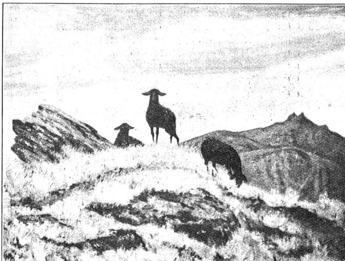
U. W. Züricher. — Auf freier Höhe.

U. W. Züricher geht in seinen Bildern ganz offenkundig vom Erlebnis aus. Und zwar führt er uns schlicht