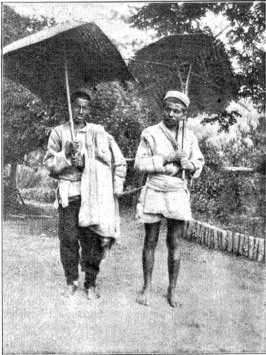
„Modern Umbrellas“ Kodiali. (Zwei Küberbuben mit selbstgemachten Sonnenschirmen.)

einisch e gstudierte Aengländer het ghöre Latin rede: „Vinai, vaidai, vaissai“, (veni, vidi, vici), dä weiß, was si i däm Stück chönne leischte. Es dräie sech allwäg nid nume di alte Römer, sondern o di alte Indier all Tag im Grab